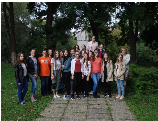
Csoportunk a dunaalmási Csokonai-szobornál