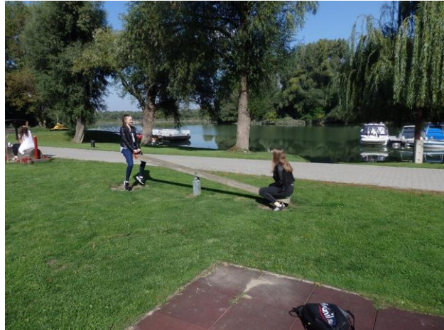
Duna part, Neszmély

Miután múzeumi látogatásunk véget ért, a csoport szabadidős tevékenységnek a Hajóskanzen környékének felkeresését választotta. Lesétáltunk a Duna partra, és ott töltöttünk egy órát. A kiállítás mellett volt egy játszótér, ahol mindenki talált számára megfelelő elfoglaltságot, ami sok nevetéssel társult. A móka után a csapat megéhezett. A Rétes Pajtában finom tokányt ehettünk rizzsel. Mivel az ebéd nem az igazi desszert nélkül, elmentünk a faluban található cukrászdába, ahol nagyon finom rétest kaptunk.