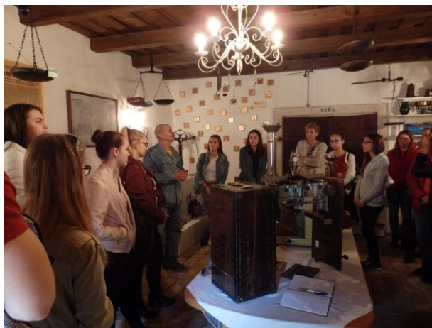
„Mérickske” – mérésügyi kiállítás Neszmélyen